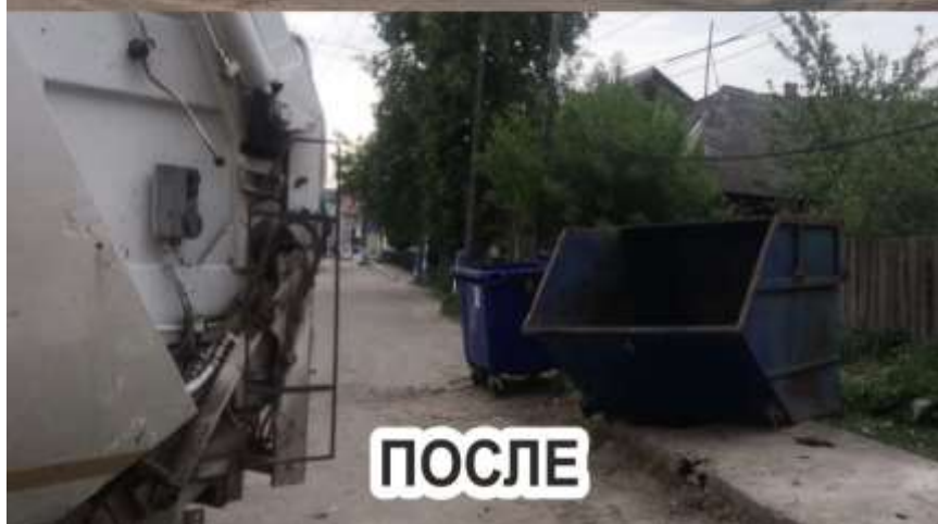
4. Проводился вывоз мусора с территории озера Юлово