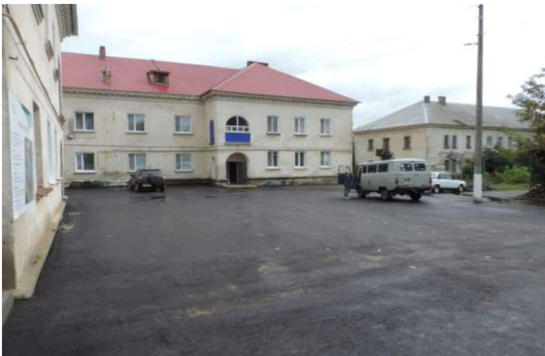
13. Проводился косметический ремонт подъездов многоквартирных домов