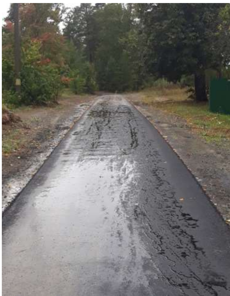
12. Проводилось благоустройство придомовых территорий