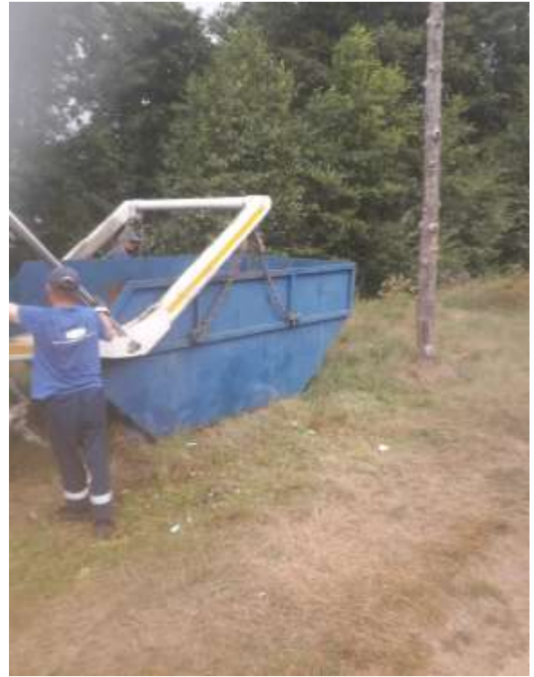
5. Проведено благоустройство берега озера Юлово